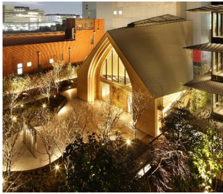
THE THOUSAND KYOTO 3階に位置する「KOMOREBIDO (コモレビドウ)」