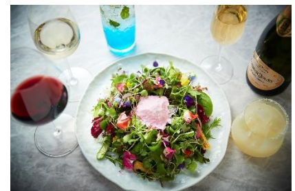
アパタイザー「菜園」お 1 人様 1 皿ご提供

このアパタイザー「菜園」のほかに、イタリア料理「SCALAE」の“おとなの縁日”をテーマにした特別メニューもオーダーいただけます。（料金別途）