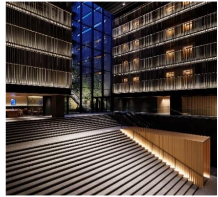
ホテルのシンボリック的存在「大階段」