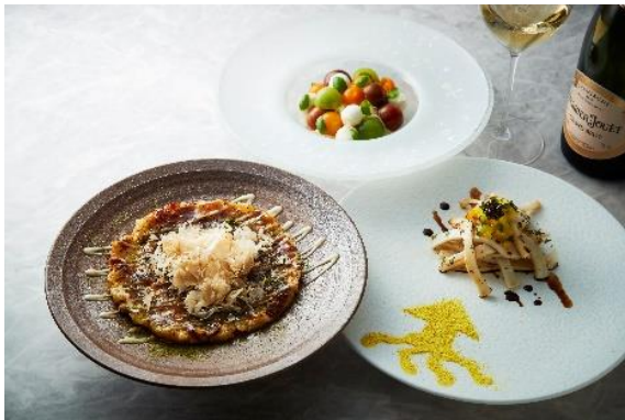
(手前左) フォンドボーとお好み焼きリゾット 1,300円 (手前右) スカーラエのイカ焼き 1,200円 (奥中央) トマトティーナ 1,500円

イタリア料理「SCALAE」では、「お祭り」や「縁日」をイメージした遊び心のある特別メニューをご用意いたしました。見た目がお好み焼きそっくりなパルミジャーノチーズリゾット、イカ焼きを SCALAE 風にアレンジしたアラカルトなどが登場。さらには、フォアグラのコンフィをテリーヌ状にし、相性の良い甘いジャムでコーティングをした「フォアグラ→リンゴ飴」なども。イタリア料理「SCALAE」のシェフの独創的なアイデアと革新的な技術が詰まった一皿は、その見た目と味とのギャップに、思わず胸が躍ります。