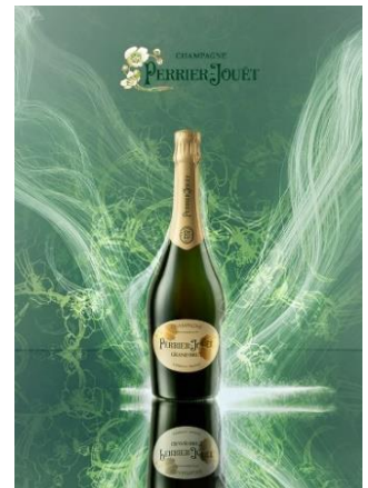
メゾン ペリエ ジュエの伝統を受け継ぐ 「ペリエ ジュエ グラン ブリュット」

その他、赤・白ワインやウイスキー、各種カクテル、ノンアルコールドリンクもフリーフロー内でお楽しみいただけます。中でも、縁日にちなんだ「ラムネ」や関西の夏の定番「冷やし飴」を使用したオリジナルカクテルは必見。グラスを傾けながら、気持ち華やくひとときをお過ごしください。