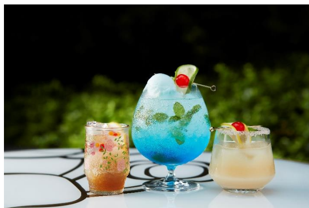
お祭りや縁日をイメージしたオリジナルカクテル (冷やしあめハイボール、ラムネモヒート、甘酒ソルティドッグ)

京阪グループのフラッグシップホテル「THE THOUSAND KYOTO (ザ・サウザンド キョウト)」は、チャペル前に広がる幻想的な奥庭ガーデンで、シャンパーニュ「ペリエ ジュエ」やこだわりのオリジナルカクテルを含むドリンクフリーフローやイタリア料理「SCALAE」のシェフこだわりのお料理が楽しめる「Champagne Night」を、2020年9月26日(土)までの毎週金・土曜日限定で開催しております。