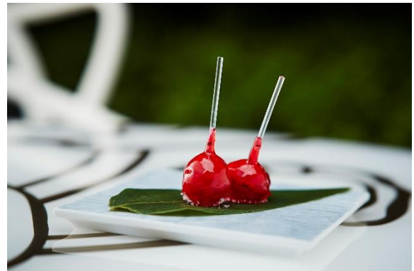
フォアグラ→リンゴ飴 1,400円