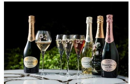
メゾン ペリエ ジュエの上質なシャンパーニュ (左から順に)「ペリエ ジュエ グラン ブリュット」 「ペリエ ジュエ ブランドブラン」 「ペリエ ジュエ ベル エポック 2012」 「ペリエ ジュエ ブラゾン ロゼ」

それぞれに色合い、アロマ、味わいの異なる上質なシャンパーニュの飲み比べを楽しみながら、ご自身のお気に入りの 1 杯を見つけてみては。