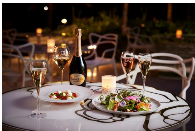
Champagne Night のフリーフロープラン