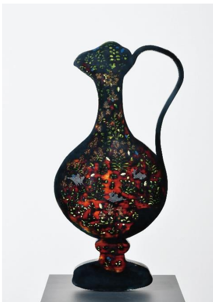
『絵のふりをした壺』