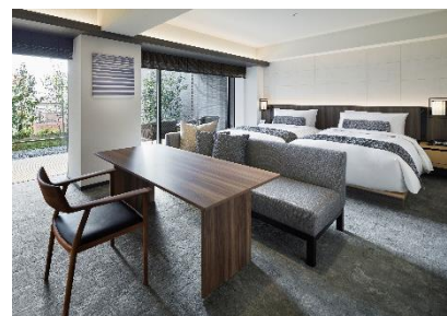
プレミアールーム一例「プレミアツイン」