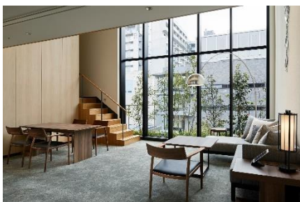
スイートルーム一例「ザ・サウザンド・スイート」

ホテルのデザインコンセプト“Comfort Minimalism”を体現した7タイプのスイートルームと3タイプのプレミアールームをご用意しています。茶道や禅に通じる引き算の美学をもとに、京都で育まれた豊かな知恵を随所に取り入れたしつらえで、一人ひとりに心地よい時間をお届けします。ミニマライズされた清々しい客室からは、心やすらぐ坪庭がご覧いただけます。