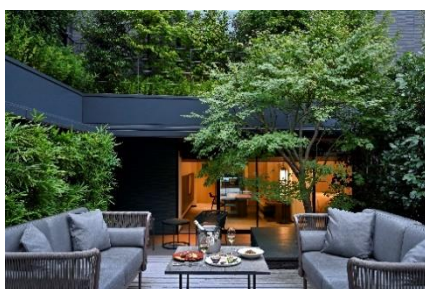
スイートルーム一例「ガーデン・スイート」