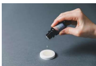
オリジナルアロマオイル 5ml & ストーンセット 2,950 円 (税込)