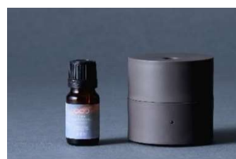
オリジナルアロマオイル 10ml & ファンディフューザー-kō (コウ) セット ¥6,900 (税込)