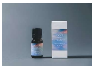
オリジナルアロマオイル 10ml