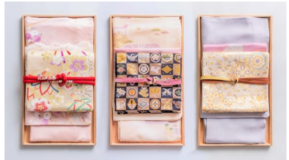
レンタル着物（小紋・名古屋帯）組み合わせ一例▶