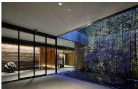
▲エントランスの「坪庭」

エントランスの「前庭」、「坪庭」から始まり、「通り庭」をリデザインした通路、その先に広がる「中庭」に見立てたロビー。そしてホテルの象徴である大階段の先の「奥庭」へ。京町家の持つ緑のリズム、庭の文化を表現しています。各所に庭、緑を設えることで、レストラン、客室、宴会場など、ホテル内どこにいても緑が楽しめます。