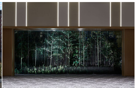
▲ザ・バンケットスタジオ SEN